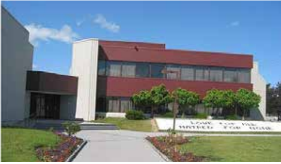
مابل - كندا

في المرحلة الأولى أي في السنتين الأوليين، وفي المرحلة الثانية الممتدة على خمس سنوات يتعلم الطلاب ترجمة معاني القرآن الكريم وتفسيره، والحديث النبوي، والتاريخ الإسلامي، والفقه الإسلامي، ونبذة عن التصوف، وعلم الكلام ومقارنة الأديان والرد على المطاعن المثارة ضد الإسلام؛ والدراسة المعمقة لكتب سيدنا المسيح الموعود عليه السلام والتمكن من الدلائل والدعوى التي قدمها عليه السلام ، وتفنيد الاعتراضات المثارة ضد الجماعة، والتمرن على فن الخطابة. وقبل التخرج يُعلم الطالب شيئاً من الفروسية والسباحة وقيادة السيارة. ولنيل شهادة «الشاهد» ينبغي عليه تقديم أطروحة علمية كمشروع للتخرج.