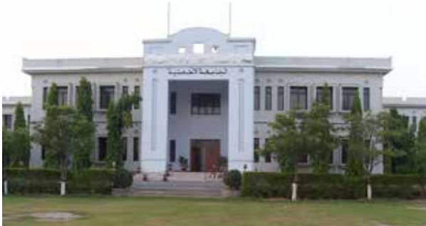
ربوة - باكستان