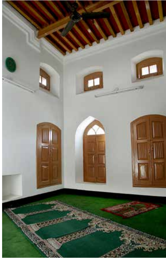
الغرفة التي اعتكف فيها سيدنا أحمد عليه السلام لأربعين يوم في هورشياربور (الهند) وتلقى فيها وحي الله بمولد حضرة المصلح الموعود عليه السلام كسيدنا عمر رضي الله عنه .

إضافة إلى الأمور السالفة الذكر، فإن إقامة نظام الجماعة، وإنشاء الفروع، وإقامة مجلس الشورى، وترويج السنّة الهجرية الشمسية، وبداية الإحصاء في الجماعة على شتى المستويات، والترويج لذوق الشعر، وقوة الخطاب، واتخاذ لقب «أمير المؤمنين»، والسياسة والتدبير، والاهتمام بحقوق النساء وتعليمهن، وإنشاء شبكة واقفي الحياة من أجل نشر الدين، باختصار هذه الأمور ومثلها الكثيرة الأخرى هي خصائص ومزايا حضرته في هذا العصر كسيدنا عمر رضي الله عنه .