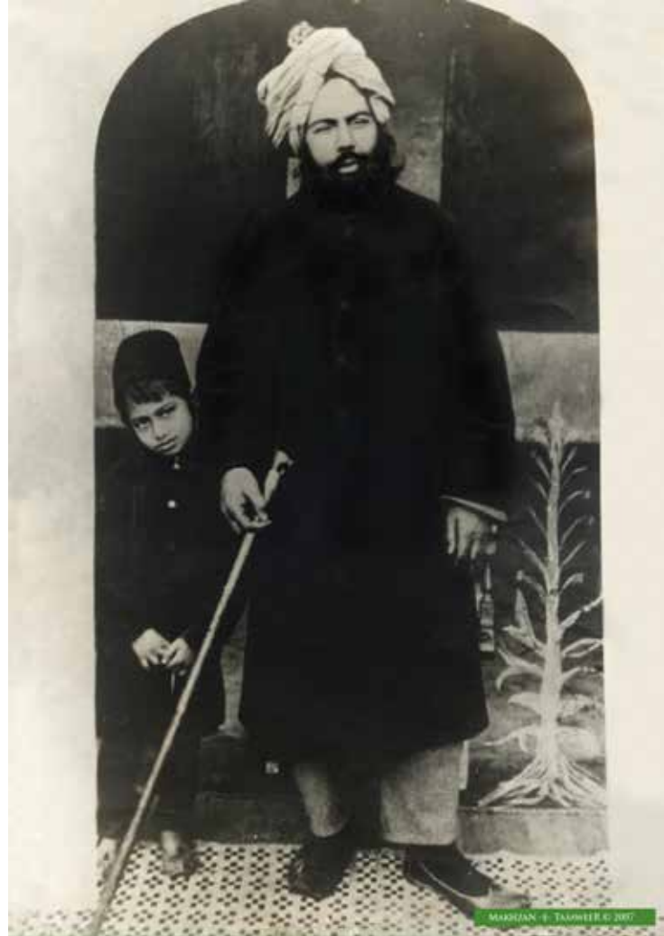
سيدنا أحمد عليه السلام ومعه نجله حضرة المصلح الموعود عليه السلام