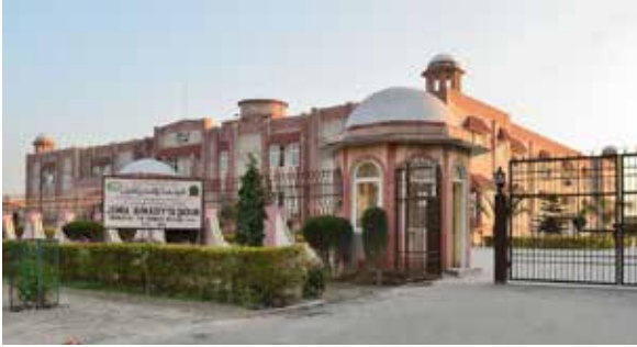
قاديان - الهند