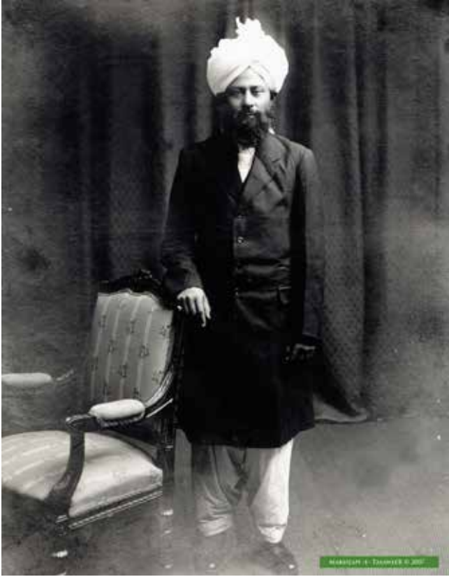
حضرة المصلح الموعود ﷺ

«إنني أعلن هنا مقسماً بالله وبأمر منه ﷺ أنه كشف عليَّ أنني أنا الابن الموعود في نبوءة المسيح الموعود ﷺ، الذي سينشر اسمه ﷺ في أرجاء العالم.»