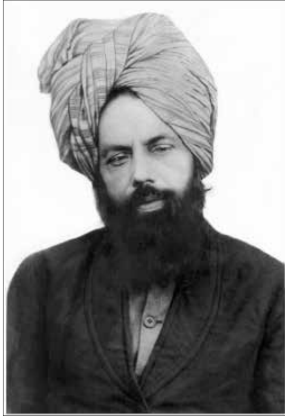
سيدنا مرزا غلام أحمد القادياني المسيح الموعود والإمام المهدي عليه السلام

وتقي جداً. وبعد ذلك سافرنا إلى دلهي لقضاء العطلة حيث شغلنا فكرة زواج والدتك لكونها قد بلغت سن الزواج. وكتب مير صاحب رسالة إلى والدك قال فيها: إنني كثير التفكير في أمر زواج ابنتي فادع الله تعالى أن ييسر إنشاء هذه العلاقة مع رجل صالح. فردّ عليه والدك: أنا أيضا أريد الزواج