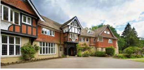
هيميزير - المملكة المتحدة