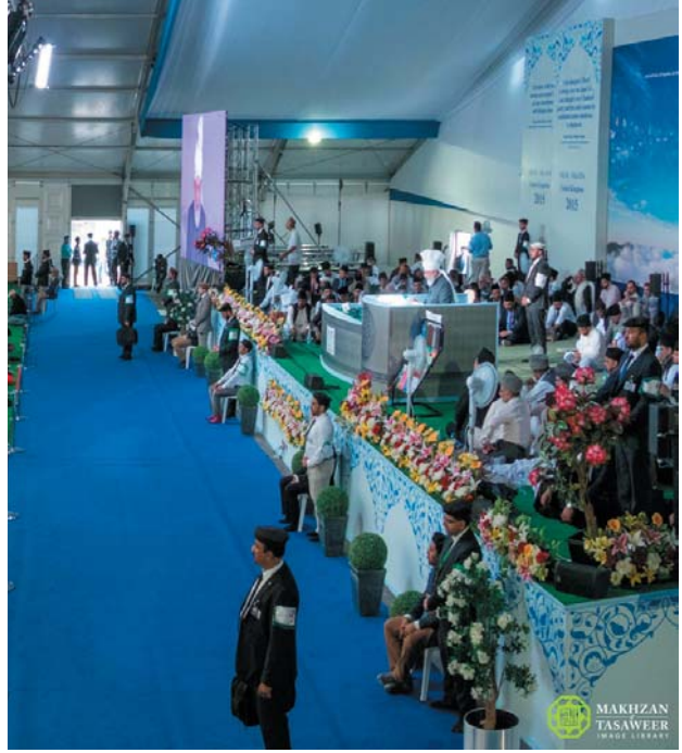
المنصة الرئيسة للجلسة

على ما أذكر، وكنا سنركب المصعد فأبقى أحد الخدام باب المصعد مفتوحا في انتظارنا، وفي هذا الأثناء جاءت عائلة متكونة من زوجين وطفلين وأرادوا ركوب المصعد ولكن الخادم منعهم، فقلتُ له أن يسمح لهم بالركوب لأنهم وصلوا قبلنا فهم أحق بالركوب قبلنا، ولكن السيدة في تلك العائلة كانت خلوقة كثيرا فتوقفت وأشارت على زوجها بالانتظار والسماح لنا بالركوب قبلهم، ولكنه نهرها بشدة إلى درجة الظلم وظل ينهرها طويلا، حتى بدأت السيدة بالبكاء ولكن لم تنبس ببنت شفة. وكان يبدو كأن هذا الشخص ليس من أهل أوروبا بل ينحدر من فئة الأوباش والجهلاء. وكانت رحابة صدر تلك السيدة وندامتها وصبرها جديرا بالإشادة فعلا. الصبر الذي لاحظتُ في تلك السيدة لعلّ قلة قليلة منكن تستطيع إبداءه. فحرية المرأة عندهم لا تضمن حقوقها بل تدفعها إلى التعري فقط. المرأة المؤمنة التي تُعدّ نفسها عضوة في منظمة "لجنة إماء الله"، وتؤمن