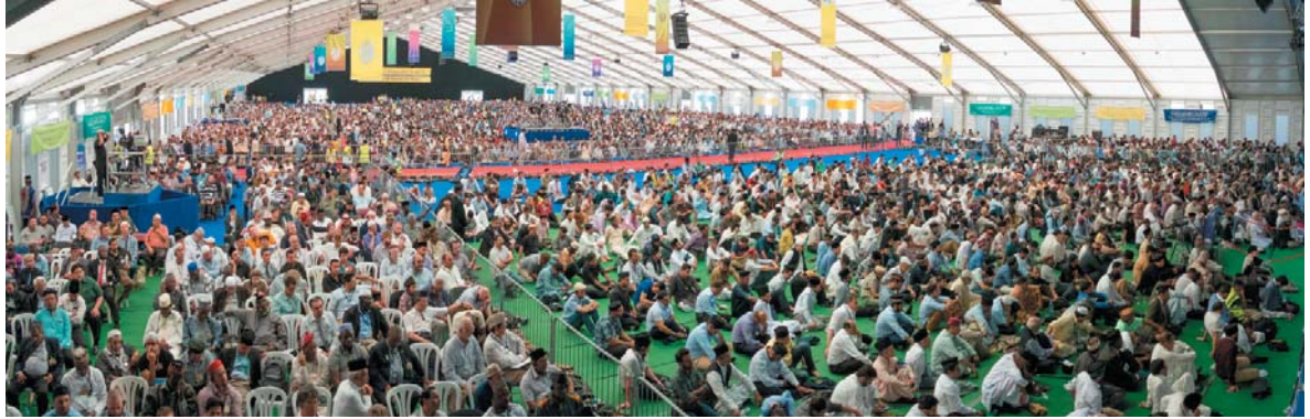
مشهد عام للحضور في خيمة الرجال

حال عدم أدائها، فلعلكم لن تتزوجوا حتى واحدة ودونكم أن تفكروا بالزواج الثاني أو الثالث أو الرابع. لا شك أن الإسلام سمح بالزواج من أربعة على أكثر تقدير في ظروف معينة ولكن شروطها قاسية جدا ويكون الرجل في حال عدم الإيفاء بها مذنبا، ولو أدرك كفيته قد يتحاشى الزواج لأول مرة أيضا.